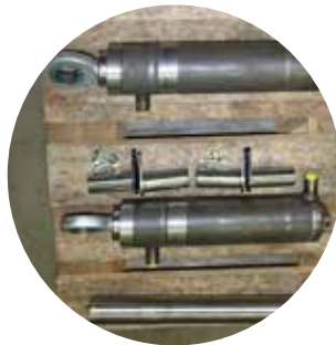
⑧ Neuer Hydraulik-Zylindersatz mit Mittelscherenbolzen und Lagerbolzen