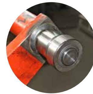
⑨ Obere Laufrolle mit neuem und verstärktem Lagerzapfen