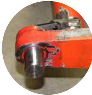
⑤ Untere Lagerung mit zusätzlicher Verdreh-sicherung des Bolzens