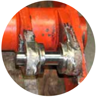
① Beiseitig erneuerte Zylinderaufhängung oben von der Innenschere