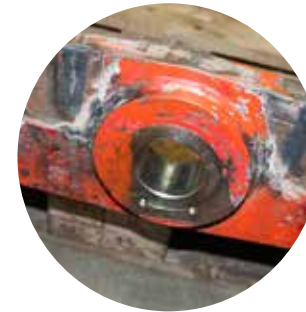
⑥ Erneuerte Lagerung für den Mittelscherenbolzen