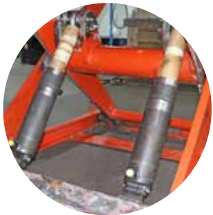
⑦ Blick ins Innere des Scherenhubtisches (zylinderseitig) nach der Überholung