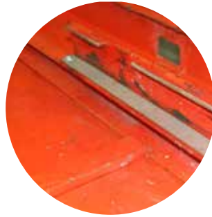
② Untere Laufschiene im Inneren der Plattform, Laufschiene mit Verschleißleiste auf der Lauffläche