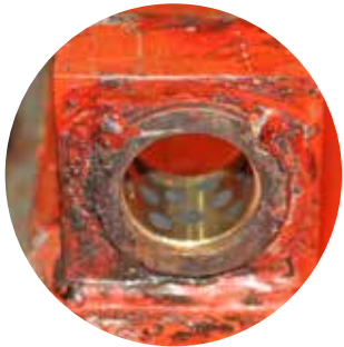
④ Untere Lagerung abgeändert von DU-Gleitlagerbuchse auf massive Bronzebuchse mit Festschmierstoff